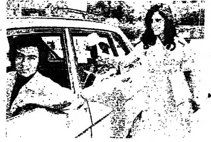
ايين الزمار العربية للبنان ؟

كان لبنان جسرا وممرًا لثروة العرب ، ولكن الجسر التحم بالعرب ، والعرب تقزوا فوق الجسر واتصلوا بالعرب ، واتصل العرب بهم .. لبنان اصبح منافسا للغرب ، وهم يرحبون بازائه ، ليتعلموا مباشرة مع عرب النفط ..